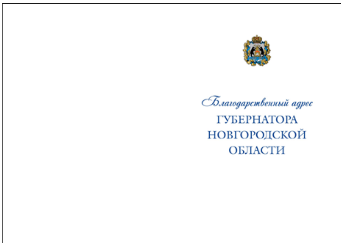
Рисунок 1. Лицевая сторона Благодарственного адреса Губернатора Новгородской области